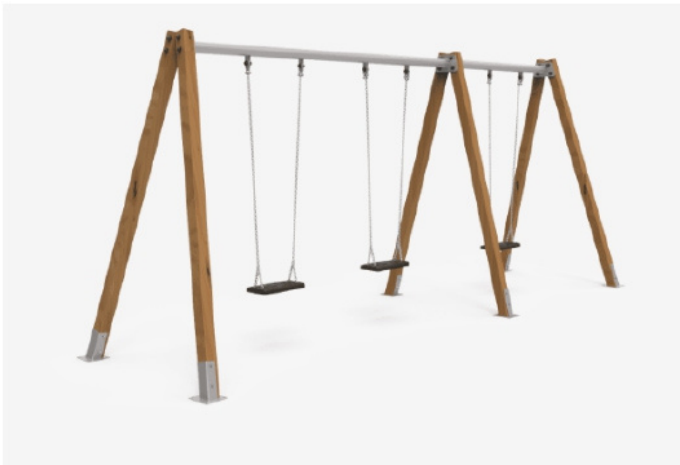
Columpio Combo 3 JL2103000

Columpios infantiles de diferentes materiales como madera y acero. Columpios para niños con gran resistencia a la abrasión, corrosión y muy resistentes a la intemperie.