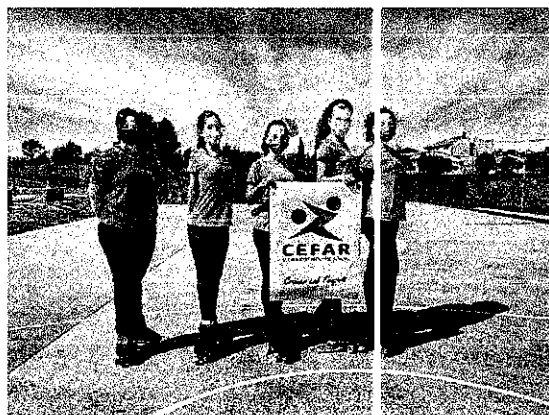
Entrenadora i esportistes de CEFAR.

Grup 1: grup format per nenes i joves que ja porten temps patinant i que s'entrenen amb l'objectiu de perfeccionar la tècnica del patinatge.