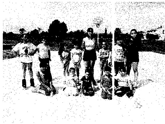
Patinadores de CEFAR.

Grup 2: grup format per nens i nenes que s'inicien a la disciplina del patinatge artístic.